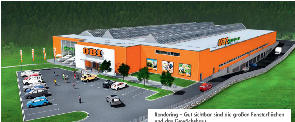
Rendering – Gut sichtbar sind die großen Fensterflächen und das Gewächshaus