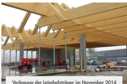
Verlegung der Leimholzträger im November 2014